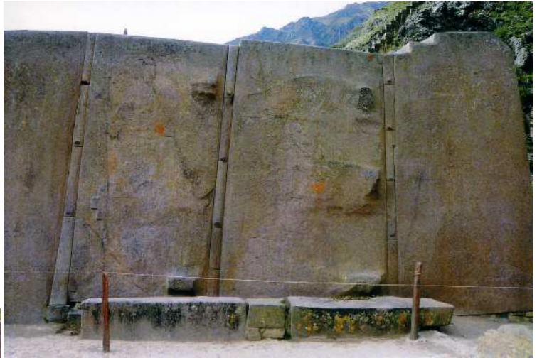
【オリヤンタイタンボ遺跡の巨石の壁】